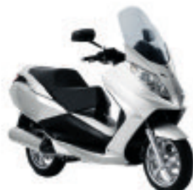
Satelis 125 (version Premium) à 3499 € (1) Satelis Urban avec freinage ABS à 3999 € (1)