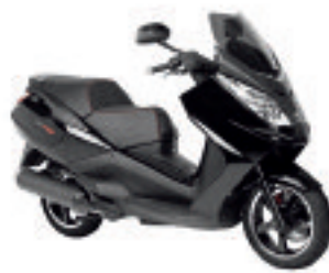
Satelis 125 RS à 3599 € (1)