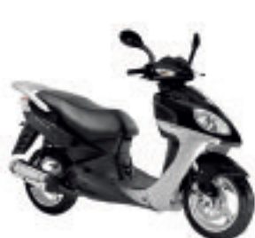
Sum Up 125 à 1749 € (1)