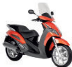
Géopolis 125 (version Premium) à 3499 € (1) Géopolis Urban avec freinage ABS à 3949 € (1)

Et découvrez aussi en concession Satelis Compressor à 4499 € (1) et Black Sat à 4599 € (1) . L'assistance 24H/24 est offerte pendant 1 an sur la gamme Satelis et Géopolis.