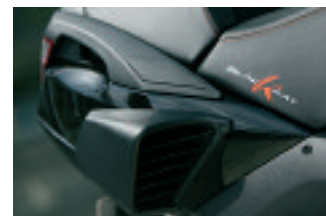
On reconnaît le modèle Satelis K aux grandes ouies latérales d'admission d'air qui alimentent le compresseur.

Côté rangements, le Satelis "K" bénéficie des mêmes équipements que le modèle standard, mais voit la capacité de son