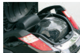
Le coffre accueille un casque intégral. La partie arrière du Satelis bascule à partir du contacteur ou du plop de télécommande.