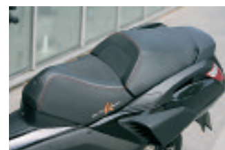
La selle du BlackSat bénéficie de surpiqûres orange, d'inserts en Alcantara et d'une empreinte à chaud du lion Peugeot sur la partie passager.